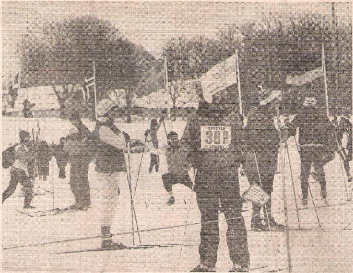
Næsten 1000 langrendsløbere havde en dejlig skisportssøndag på Søllerød Golf Klubs baner. Her gør løbere sig klar til starten på deres første ski-konkurrence i år.