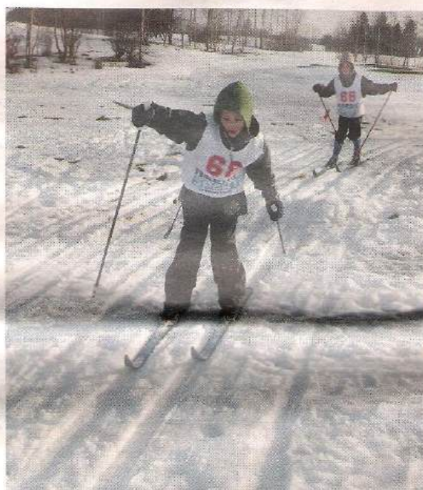
Selv om løjpen måtte forkortes og omlægges fik store og små langrendsløbere en fantastisk skidag på Hørsholm Golfbane.

Og med de kommende dages tøjvej, så bliver det nok også langrendsløbernes sidste udfoldelser i denne omgang.