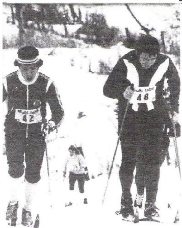
Foto fra det første Holterend i 1977.

Løbet havde deltagelse fra hele landet og flere gange dukkede der også løbere op fra Grønland.