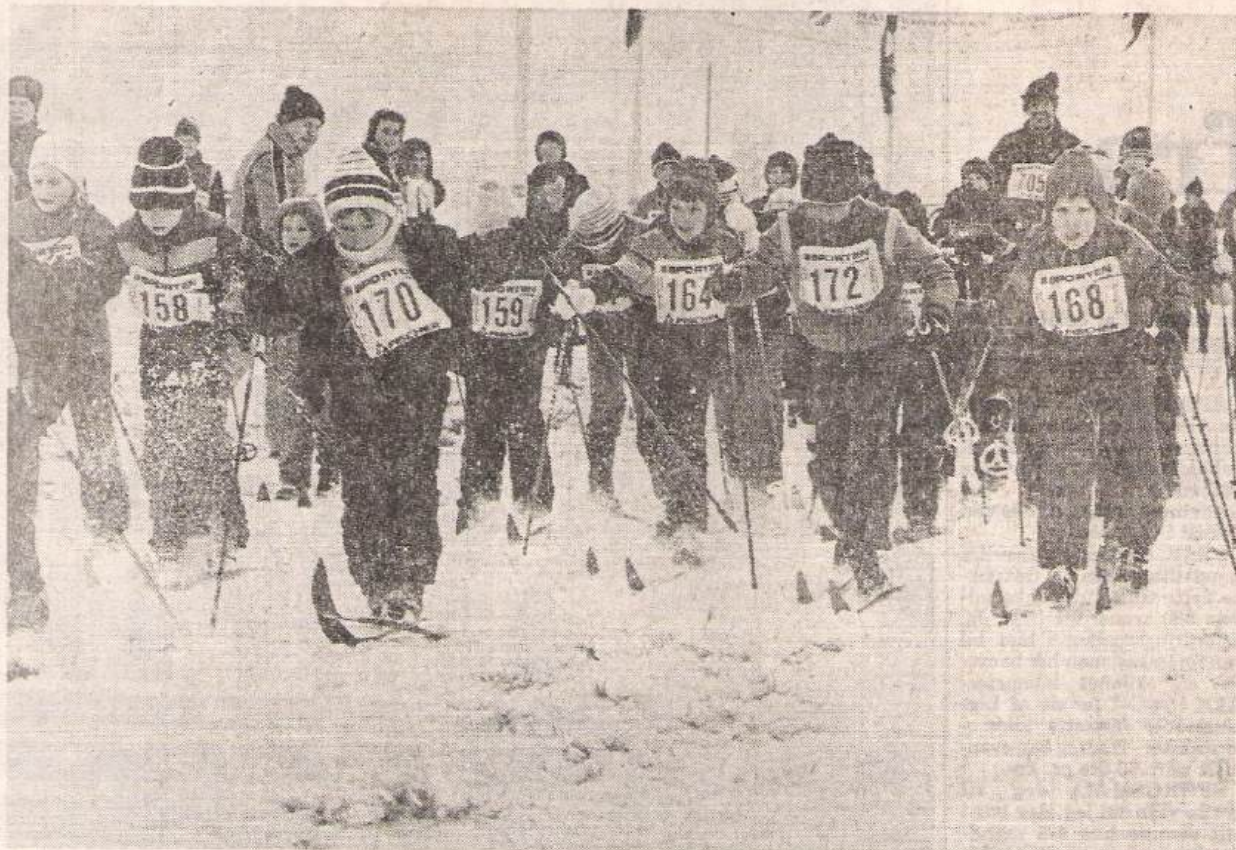
Med sne og konkurrenter om ørerne susede et halvt hundrede børn ud i terrænet med en optimistisk blanding af vilje og teknik.