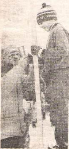
Kinderne blev røde i den klare frostluft, men der var gode belønninger ved målet.

25 mand havde termiddag tramp og ordnet sneen, blev så god og mulig. Men sne tilter kunne ingen få ikke med to sne